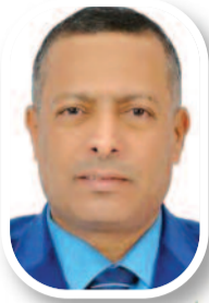
جزائر منتصرة في أفق المستقبل