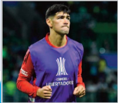
بارديس ينضم للقائمة

من جانب آخر أشاد زيدان كثيراً بإسماعيل بن ناصر رغم عدم تواجده في القائمة، في حين وصف مازة وحاج موسى بأنهما مستقبل "الخضر" وقال: "في الوسط يوجد إسماعيل بن ناصر، فإذا مرت له الكرة تعلم أنك لن تواجه مشكلة، فهو نادراً ما يفقدها ويمتلك رؤية لعب مذهلة، كما يوجد حاج موسى ومازة، وهما شابان سنتحدث عنهما كثيراً في المستقبل لأنهما لاعبان ممتازان جداً".